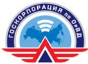
ФГУП «Госкорпорация по ОрВД»